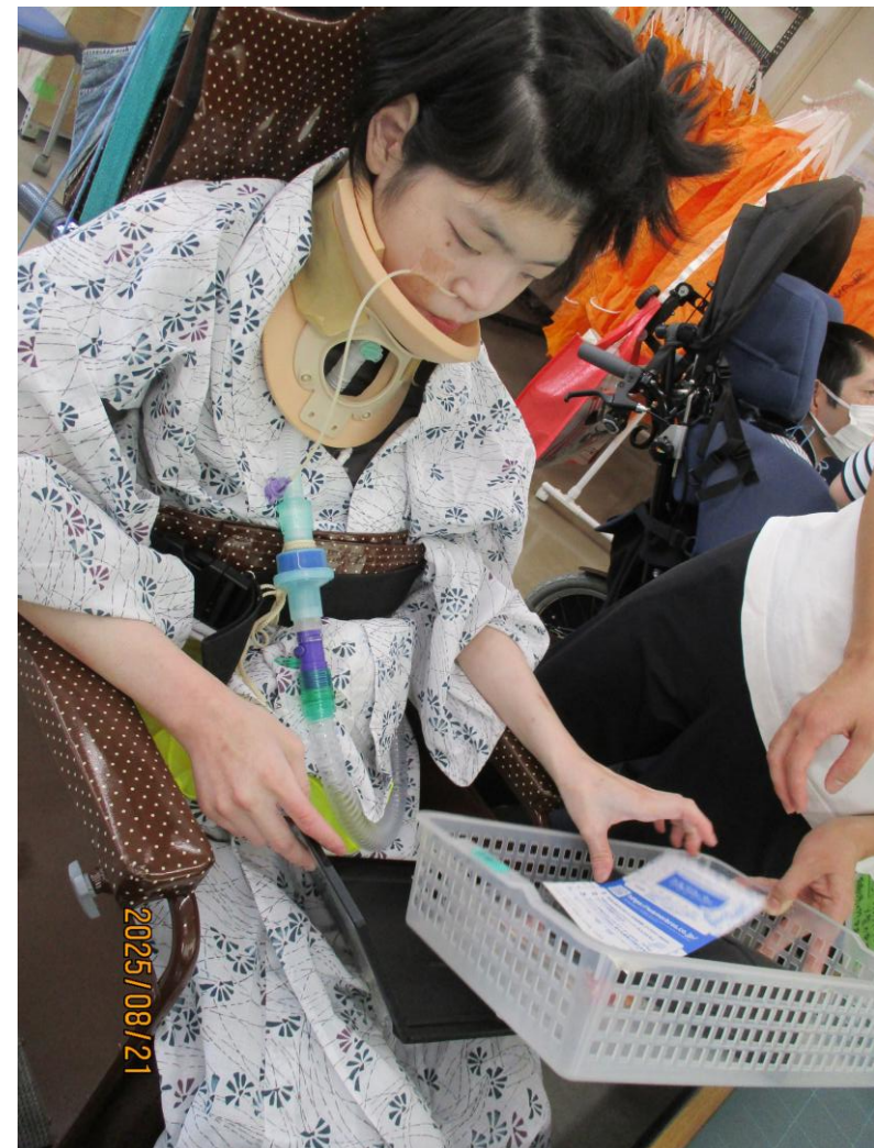
CD・DVD分解作業の様子