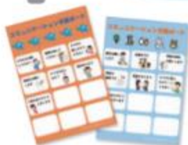
コミュニケーション支援ボード

自分の部署に障がいのある先輩が複数いらっしゃるのですが、打ち明けられる前は気づかないほど、健常者と変わらない仕事をされているので入行してとても驚いたことの1つです。障がいのある従業員も健常者と同じように自然に溶け込んでいるのが当行の良いところだと思います。